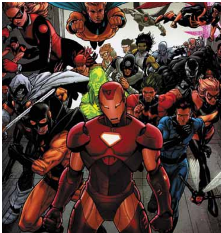
Figura 14: Homem de Ferro, heróis e os Thunderbolts .

Tal situação se acentua quando o personagem Homem de Ferro, já estando na diretoria da S.H.I.L.D.E., decide utilizar-se de criminosos “regenerados”, os Thunderbolts (Figura 14), para auxiliá-lo no combate ao crime. Uma representação dos diversos tipos de mercenários contratados pelo exército norte-americano em nível mundial, entre eles o próprio terrorista Osama Bin Laden.