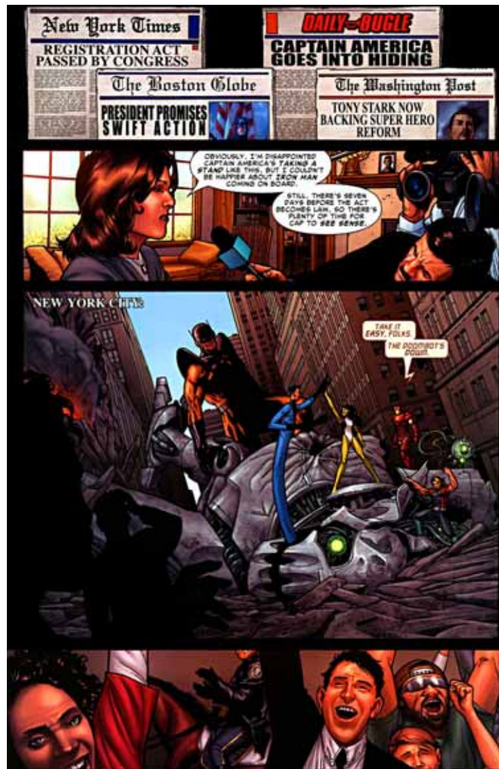
Figura 06: Apoio a coalizão em prol do Ato de Registro dos super-heróis

Fonte: Civil War # 02 . Nova York: Marvel Comics, 2006.