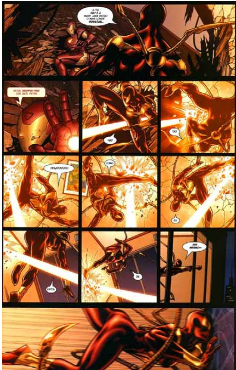
Figura 15: Homem-Aranha rebela-se contra a lei de registro de super-heróis.

aparente neutralidade, quando um dos principais ícones do apoio a lei de registro decide mudar de lado e lutar contra o sistema (Figura 15).