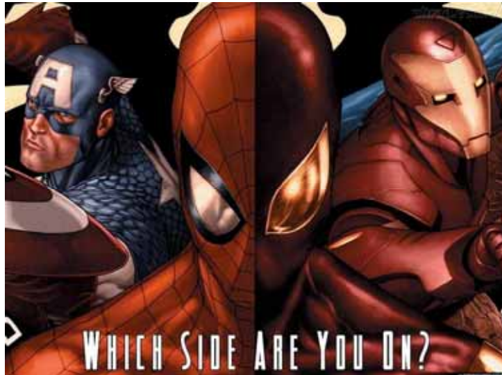
Figura 05: Capa Civil War #2

Mas, quais são os discursos sustentados pela Marvel Comics durante a saga Civil War ? É possível observá-los logo ao lançamento da saga, a qual se fez uma grande campanha publicitária sob o slogan: “De que lado que você está?”. (Figura 05)