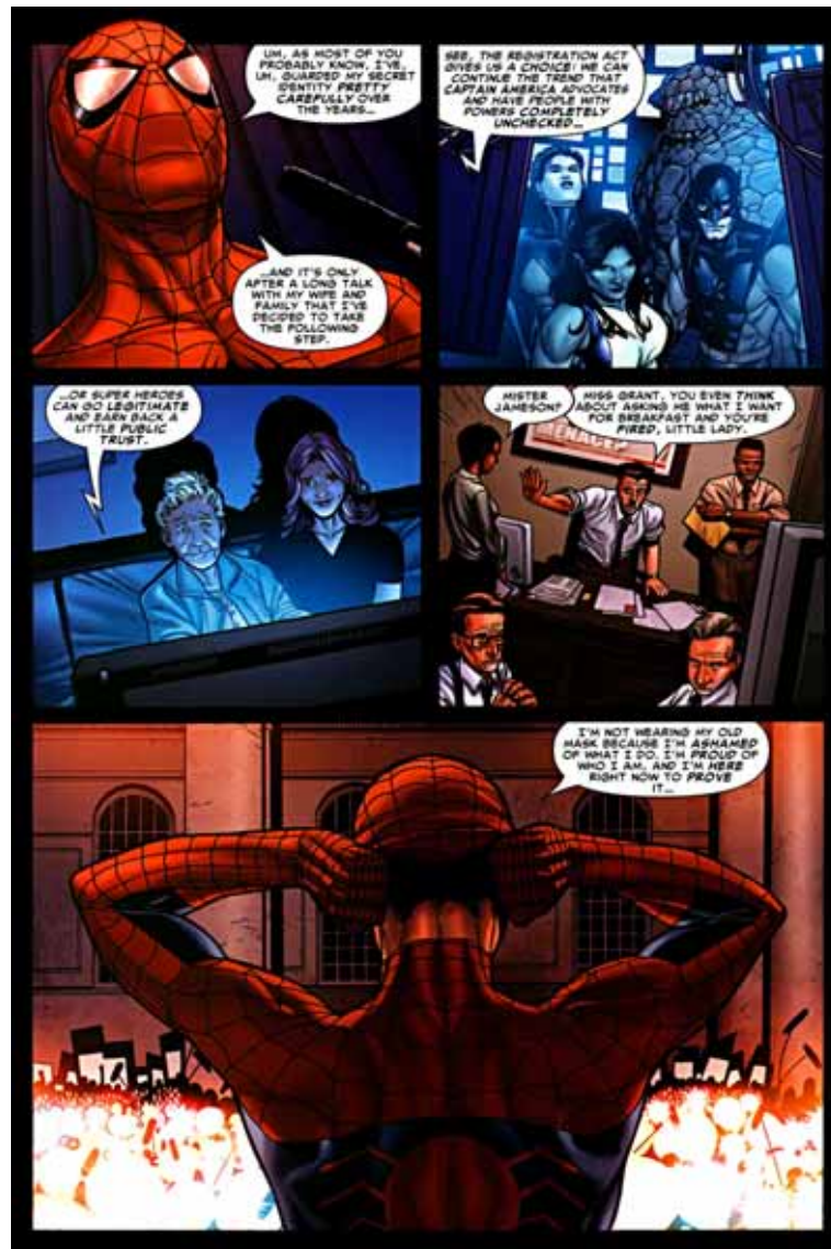
Figura 09: Propaganda pró-registro dos super-heróis. Homem-Aranha revela sua identidade.

Guerra ao Terror, resultante da invasão ao Afeganistão e o Iraque, era levar a democracia ao povo Iraquiano, depondo o ditador Sadan Hussein sob a acusação da presença de armas de destruição em massa no país. Desta forma, percebe-se que a população norte-americana não possui um entendimento de sua própria visão democrática.