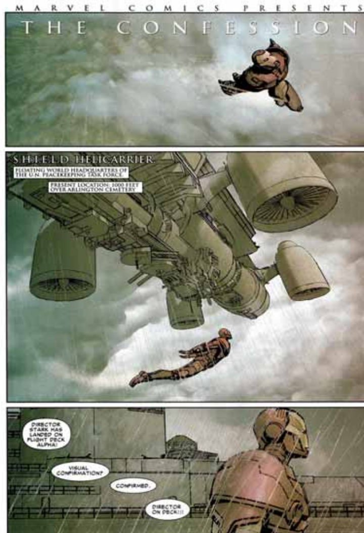
Figura 10: Homem de ferro, novo diretor da S.H.I.E.L.D.

revelação serviu como ampla propaganda de guerra a favor da política adotada pelo personagem Homem de Ferro, ao mesmo tempo que legitima a perda dos direitos individuais em prol da nação norte-americana.