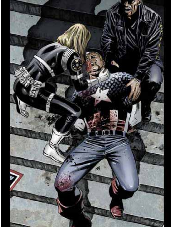
Figura 22: A morte do Capitão América.

Fonte: Civil War Epilogue . Nova York: Marvel Comics, 2006.