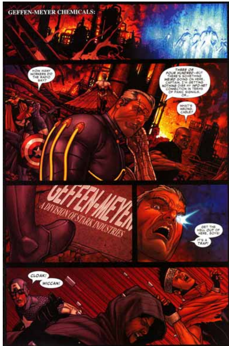
Figura 07: Emboscada para prender super-heróis não registrados.