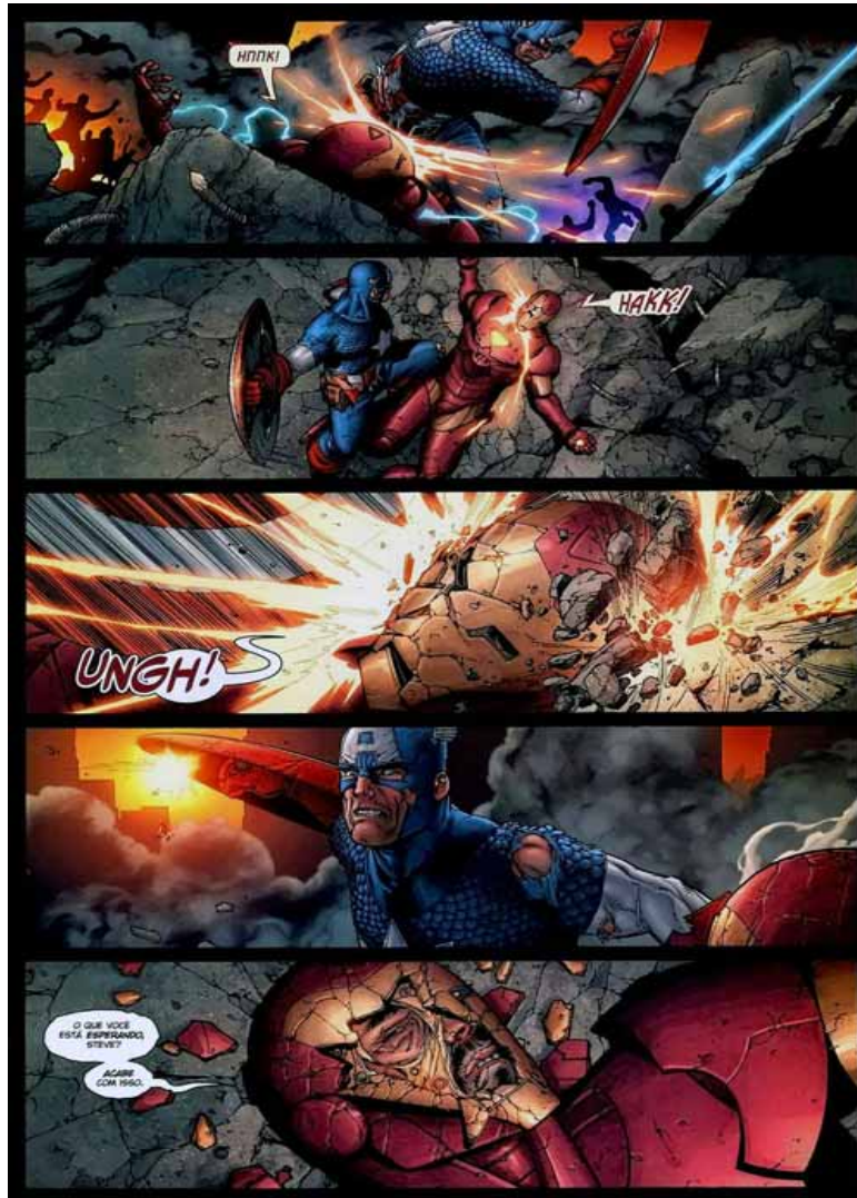
Figura 16: Capitão América vence o Homem de Ferro

Deste modo, o desfecho da história serve para consolidar o fim de um tempo, a morte conceitual da antiga visão do super-herói, que é retratada de forma dramática nas últimas páginas da publicação.