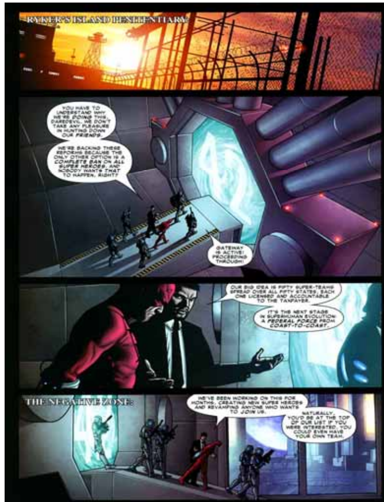
Figura 08: Super-prisão na zona negativa.

constituição norte-americana. Esta é apenas uma das diversas representações políticas constantes nesta narrativa. Deste modo, além do 11/09 e do Patriotic Act , a Civil War possui suas representações de Guantánamo 12 , da propaganda de guerra e da política armamentista, o que se remete a uma manutenção do discurso militar.