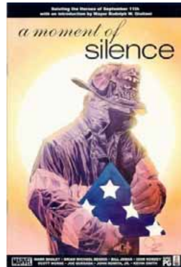
Figura 20: Capa A Momente of Silence