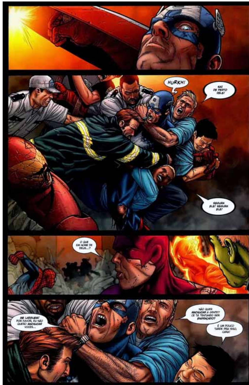
Figura 17: Cidadãos salvam o Homem de Ferro.