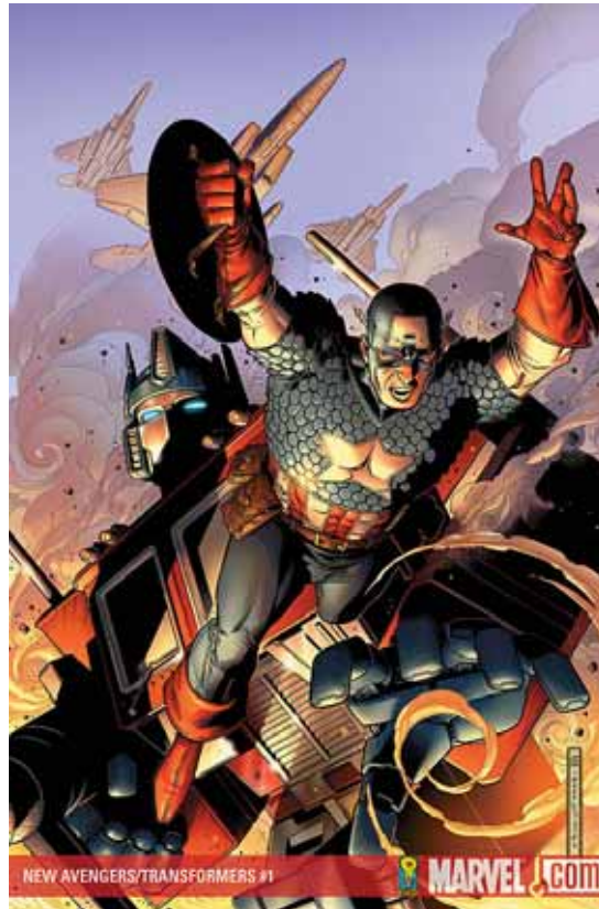
Figura 02: Capa Crossover Novos Vingadores/Transformers

Fonte: New Avengers/Transformers # 01 . Nova York: Marvel Comics, 2007.