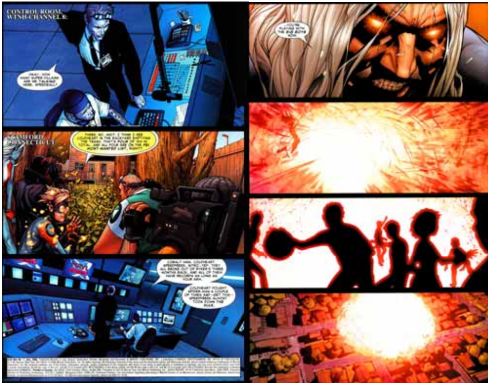
Figura 03: Atentado contra colégio de Stamford

Fonte: Civil War # 01 . Nova York: Marvel Comics, 2006.