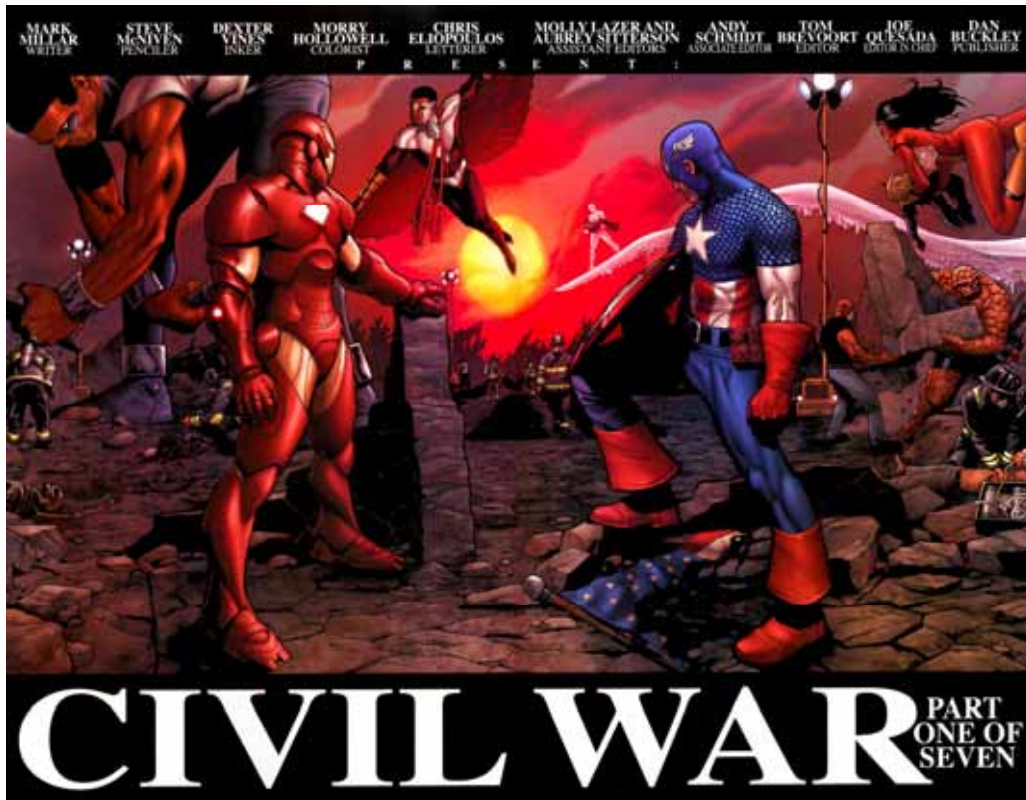
Figura 04: Pôster Especial

Fonte: Civil War # 01. Nova York: Marvel Comics, 2006.