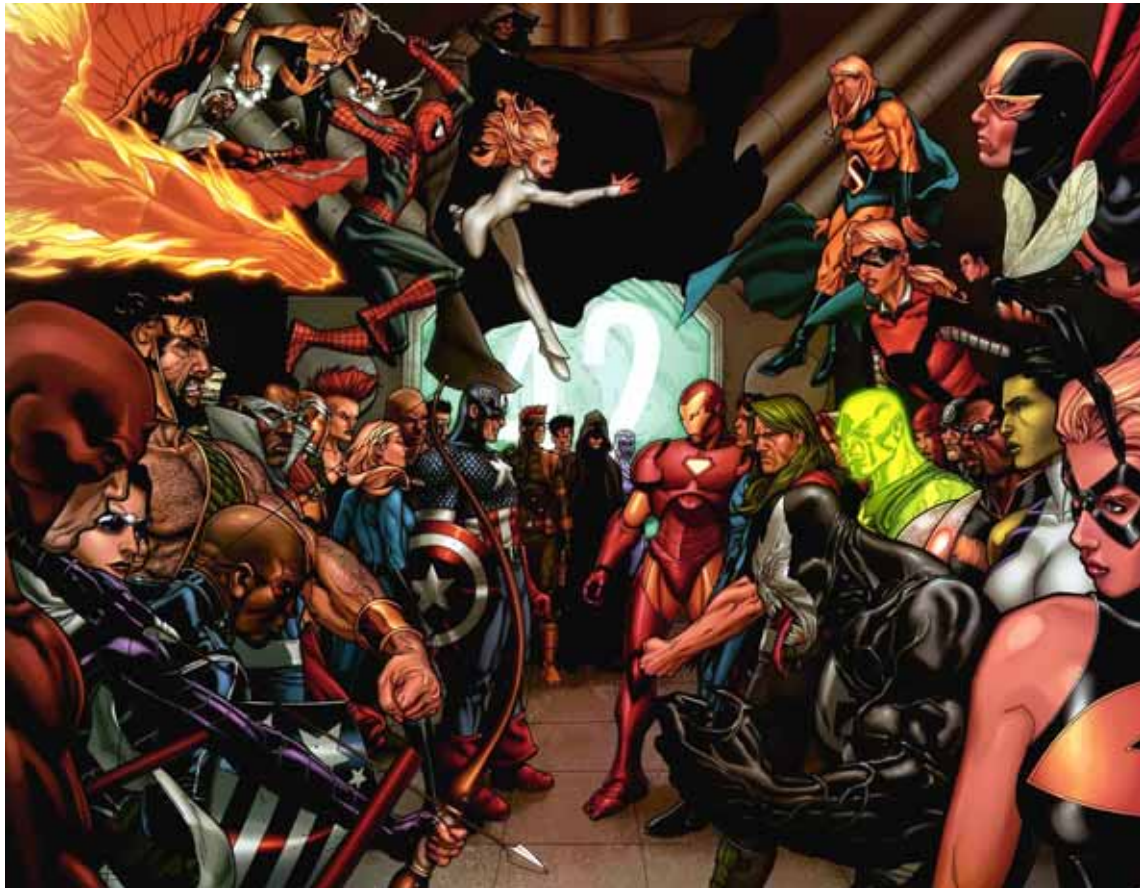
Figura 11: Confronto entre equipes pró e contra registro.

Fonte: Civil War # 06 . Nova York: Marvel Comics, 2006.