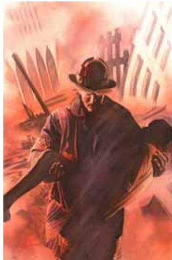
Figura 19: Capa Heroes

Fonte: EmergencyRelief . Nova York: Alternative Comics, 2002.