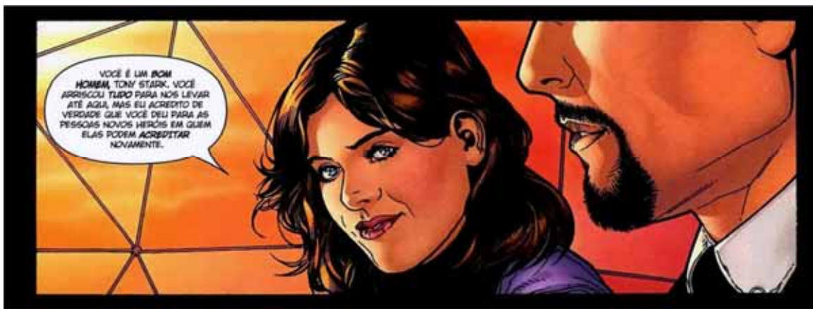
Figura 21: Última mensagem ao Homem de Ferro.

Assim, conclui-se que a Civil War não é apenas uma representação dos atentados do 11/09 e do discurso antiterrorista do governo Bush, ela é também uma re-significação da figura do herói dentro das novas perspectivas políticas dos EUA. Onde, mesmo com a dualidade sustentada por quase toda a narrativa, dá-se ao Homem de Ferro (Figura 21) e seus partidários os louros da vitória contra aqueles considerados traidores da nação.