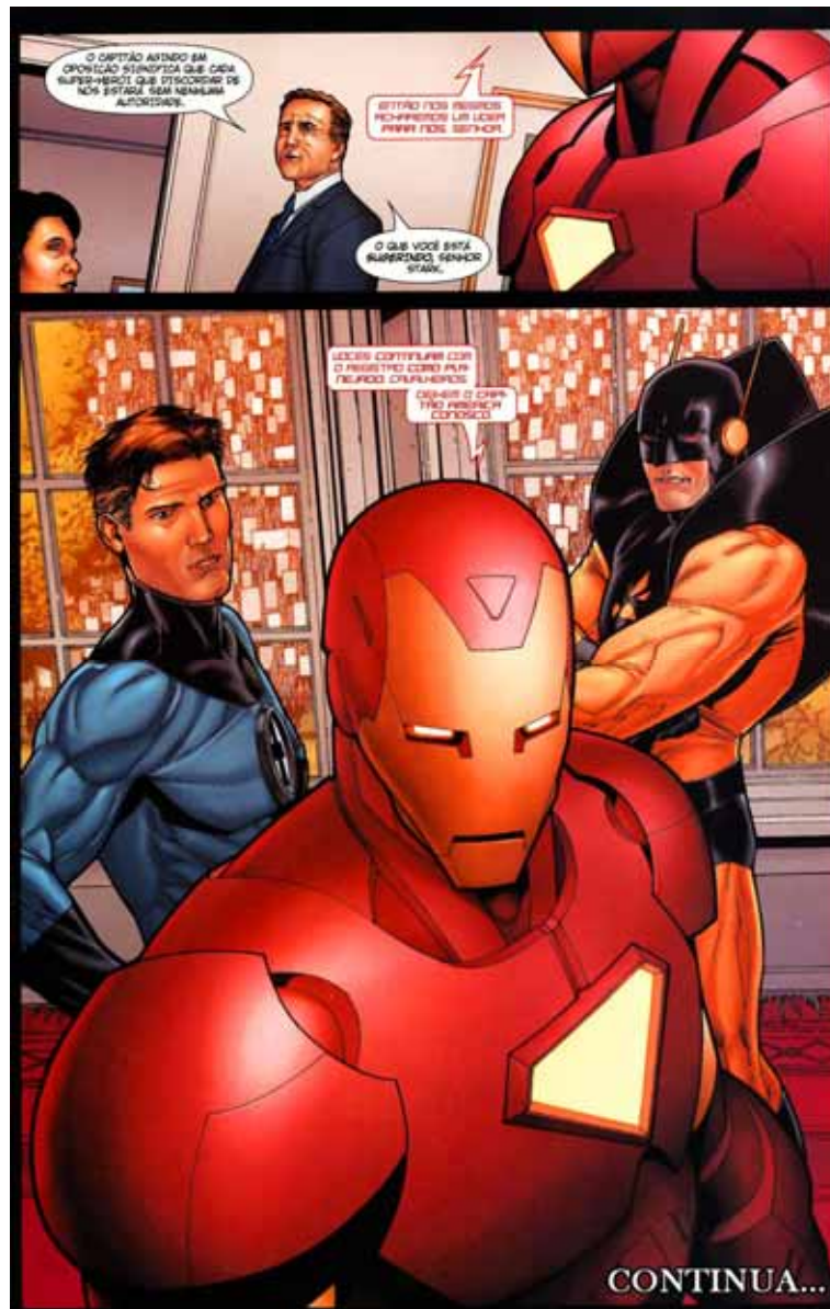
Figura 13: Homem de Ferro inicia a caçada ao Capitão América.

modo, percebe-se que há também uma remodelação do super-herói, destacando-se seu compromisso com o que é convencional por lei e pela população, não permitindo espaço para idealismos e questionamentos ao governo. Isso contrapõe em essência o próprio personagem do Capitão América, o qual transformou-se em super-herói devido a sua busca pessoal em poder lutar contra as “maldades” do nazismo.