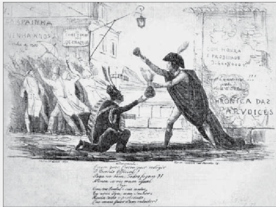
“A Campanha e o Cujo” de Manuel Araújo Porto Alegre – 1837

Fonte: Jornal da Associação Brasileira de Imprensa, n. 322, p. 3, 2007 7 .