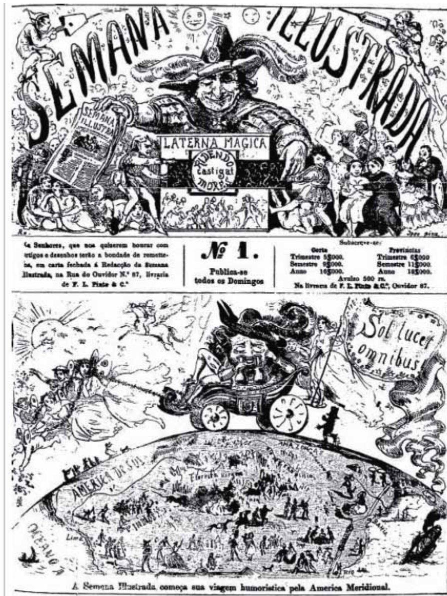
Edição nº 1 da Semana Illustrada (1860)