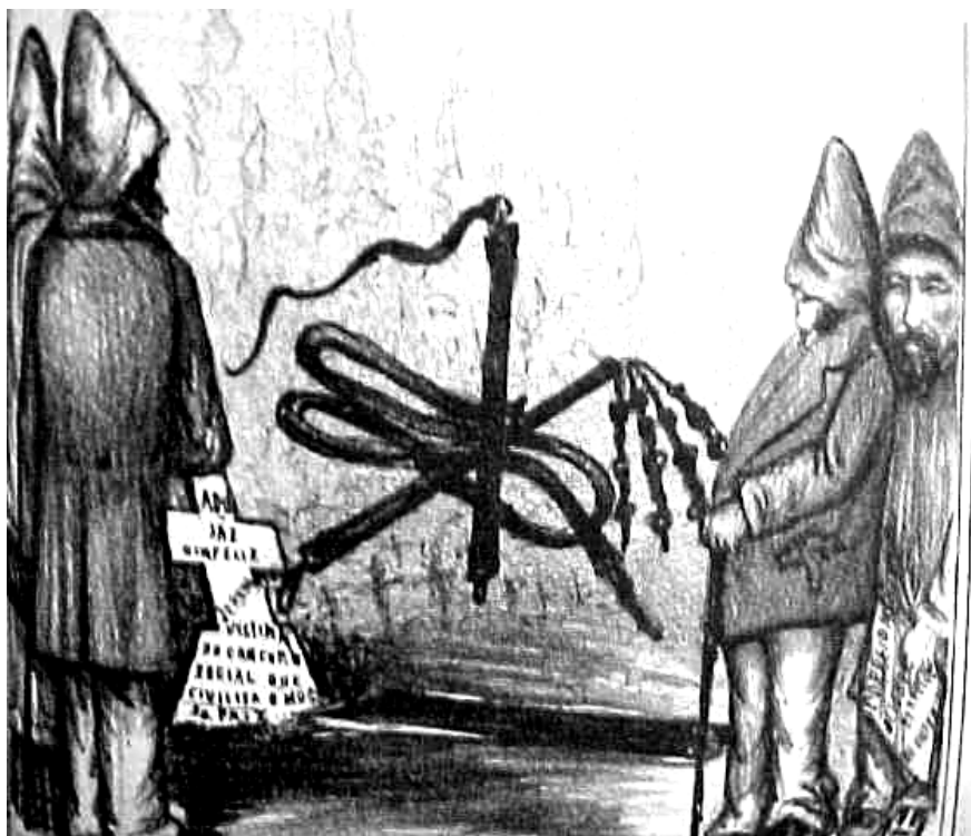
Figura 4: O assassinato do escravo Jeronymo

Legendas: (Na lápide) Aqui jaz o infeliz Jeronymo vítima do cancro social que civiliza o nosso país.