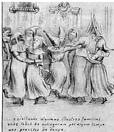
FIGURA 3: O carnaval fechado – grupo de assalto.

Legenda: ... e visitando algumas illustres familias onde todos se entregaram por algum tempo aos prazeres da dança.