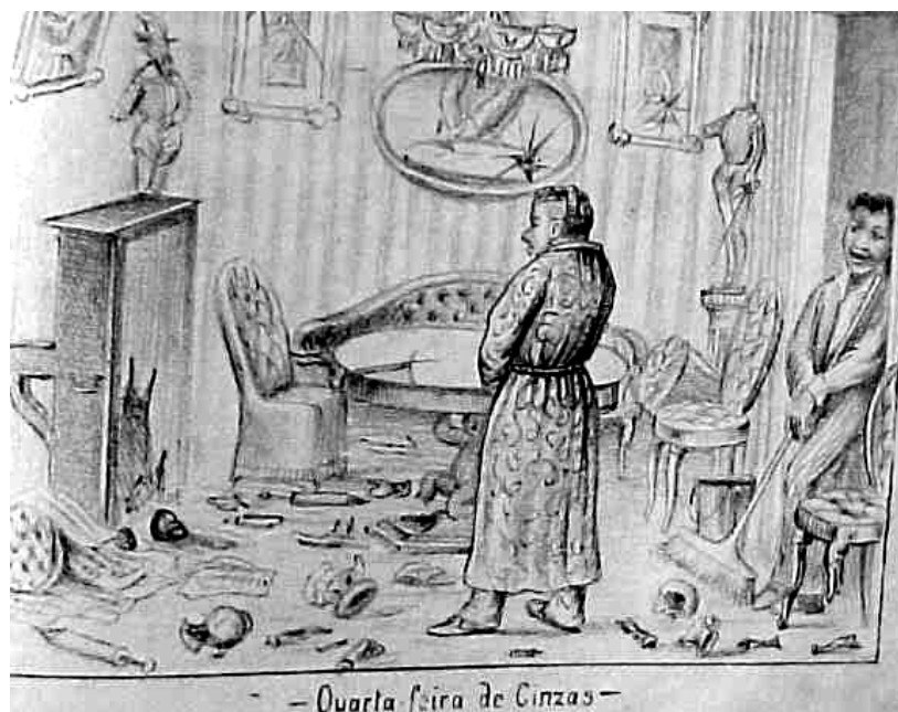
FIGURA 1: Quarta-feira de cinzas.

Retornando a citação do periódico Cabrion , que destacava a interferência policial na resolução do “grave conflito”, nota-se que a brincadeira não agradava a todos, gerando descontentamento por parte dos vitimados e sendo alvo de críticas dos redatores dos jornais. Em 1880, em artigo intitulado “Bisnagadas” o mesmo jornal fez a seguinte descrição do carnaval realizado na Praça Pedro II: “todas as noites é ali um dilúvio de bisnagas, seringas e limões, que parece um inferno...molhado” ( Cabrion , 01/02/1880). Na edição seguinte, novas críticas surgem assinadas por “Zé-bisnaga”: “Venham as críticas e alusões, venham os cancans desenfreados e abaixo o estúpido entrudo com seus brutais adeptos!” ( Cabrion , 08/02/1880). Já o periódico A Ventarola inseriu na primeira página de sua edição de 03 de março de 1889 o resultado do entrudo que, apesar do tom simpático, apresentava os resultados prejudiciais deixados pela festa. (FIGURA 1) Na ilustração ficava evidente que a prática carnavalesca do entrudo era um jogo selvagem, que destruía, com seus modos grosseiros, tudo que estivesse no caminho dos foliões. Essa brincadeira deveria desaparecer em favorecimento dos elegantes bailes, que foram o alvo principal das notícias sobre os eventos carnavalescos, tanto em 1888 como em 1889.