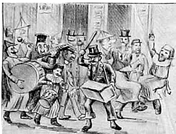
FIGURA 2: O carnaval de rua – banda e foliões avulsos.

famílias conhecidas e ricas, as críticas se transformavam em elogios como pode se averiguar na continuação da mesma crônica citada acima quando o autor Simplicio elogiou um destes grupos: “Mas... á noite, como para remate das festas carnavalescas, um grupo de interessantes jovens da nossa elite, envergando vistosos dominós, deu um passeio pela cidade, fazendo gentil visita a famílias de seu conhecimento”. Assim verifica-se que os jornais diferenciavam os foliões avulsos (os pulhas) considerados importunos, que vagueavam pelas ruas com uma fantasia medíocre fazendo sua particular pergunta e aqueles oriundos de famílias conhecidas, fantasiados ordeiros que somente visitavam casas de pessoas com a mesma condição social. Duas ilustrações veiculadas nesta mesma edição d’ A Ventarola , noticiando o carnaval de 1889, exemplificam essa constatação. (FIGURAS 2 e 3)