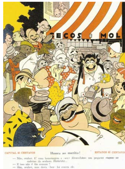
Fig. 1: J. Carlos. Careta . 16 de setembro de 1944, ano XXXVII, nº 1890.