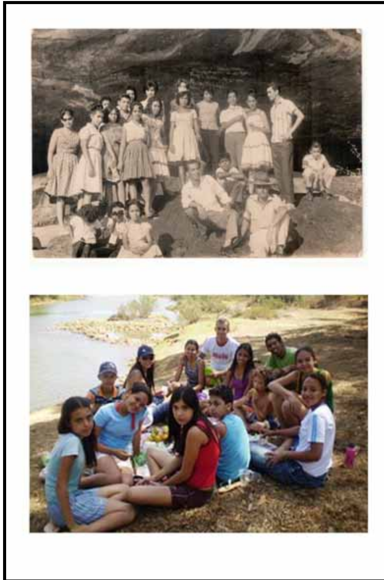
Figura 03 – Local: Sítio rupestre Lapa Pintada em Jequitaiá – MG. Grupos de amigos no ano de 1963 na primeira foto e grupo de amigos no entorno do sítio em 2008.