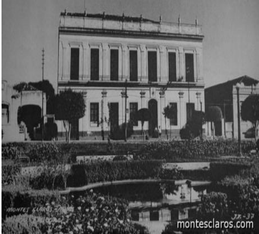
Figura 1 - Palácio Episcopal Cristo Rei e Praça Dr. Chaves.