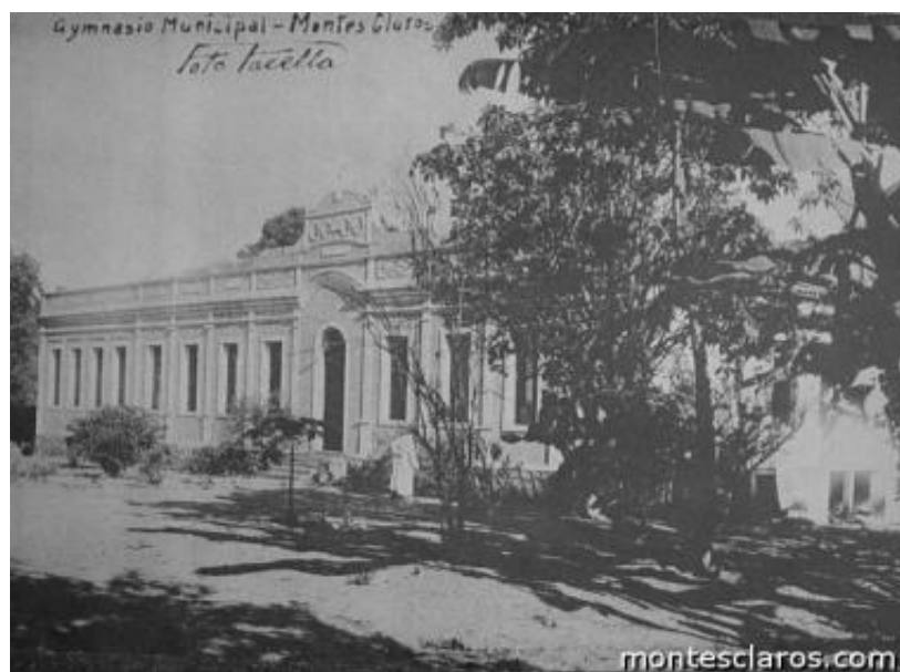
Figura 2– Ginásio Municipal de Montes Claros