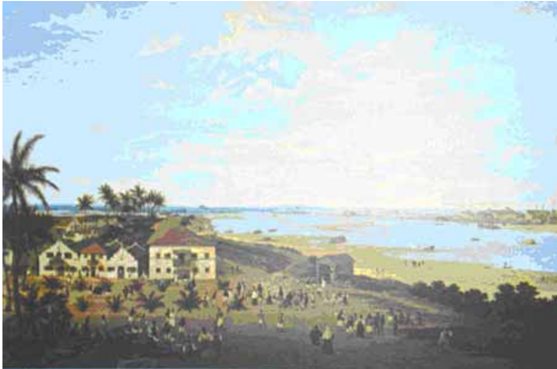
Figura 4: vila e pessoas

As obras plásticas desse holandês, inseridas em seu tempo/espaço, expõem múltiplas cenas do que viu como um exótico cotidiano vivido por personagens típicos. Suas pinturas relatam coisas do dia-a-dia presenciado por ele próprio e não meras histórias contadas por viajantes.