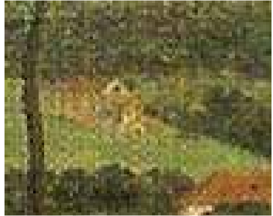
Figura 7. Detalhe da imagem, casario.