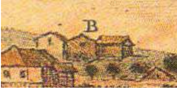
Ícone B (convento).