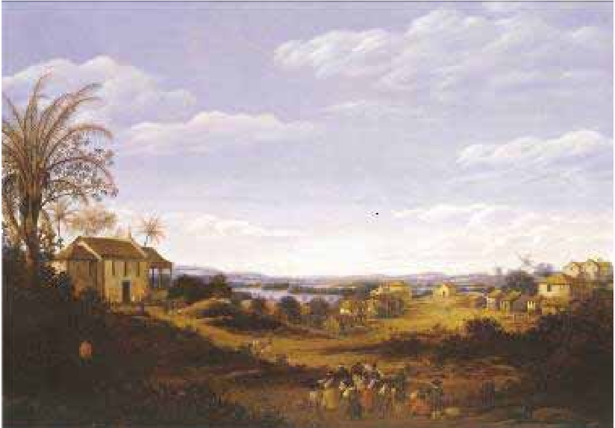
Figura 9. Vilarejo em Sirinhaém.