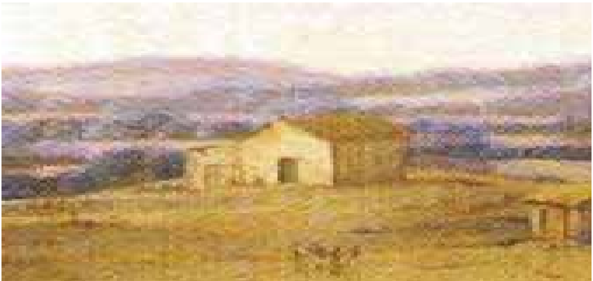
Figura 10. Detalhe da figura 26. Edificação semelhante a uma capela.