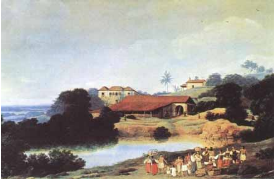
Figura 1: Engenho, de Franz Post.