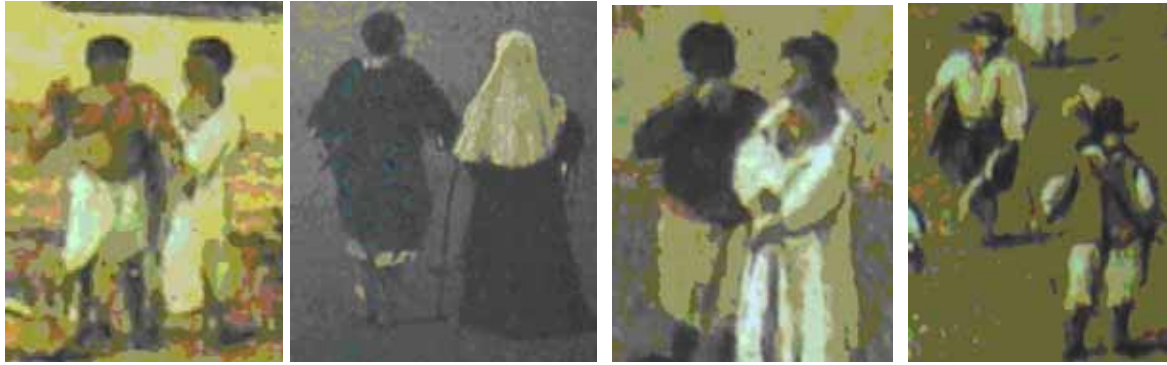
Figura 5: Casal de índios; Casal de brancos; Preto e mulata; Soldado mulato ou mameluco e soldado branco.

A aparente diferença dos sexos foi uma marca bem forte nesse período, principalmente no que se refere às vestimentas, com exceção de algumas índias (que apareciam nuas), demais mulheres compunham-se de longos vestidos, homens pretos e índios comumente de dorso nu e brancos e mulatos vestidos à européia.