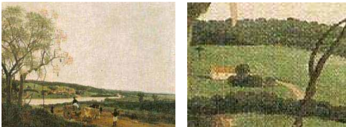
Figura 6. Carro de bois e casa.

A figura 5 também salienta personagens típicos da América portuguesa sobre domínio batavo. Roupas holandesas, como apresentadas no último quadro caminham lado a lado daquelas oriundas da moda lusitana do período. Moda e colonização eram itens que caminhavam juntas.