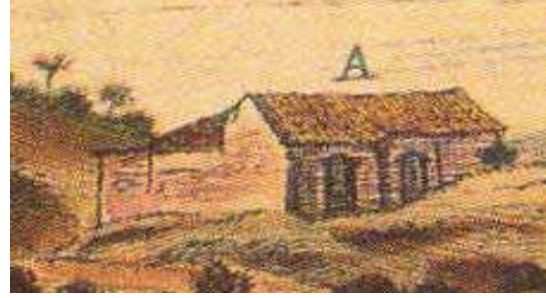
Ícone A1 (igreja – possível matriz).