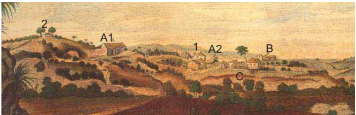
Figura 8: construções em destaque.

O rio também aparece em primeiro plano, sua importância enquanto via de transporte, fornecimento de água para animais e para moinhos, além de servir para banho e consumo é inata para o desenvolvimento colonial. A ausência de grandes matas e grandes árvores demonstra o avanço da cultura canavieira sobre as terras colonizadas.