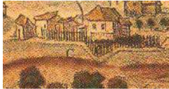
Ícone C (casa do governador).

A figura 8 e seus itens destacados demonstram construções e a transformação cultural que se evidenciou na América portuguesa a partir do processo de colonização iniciado no século XVI. Afinal: