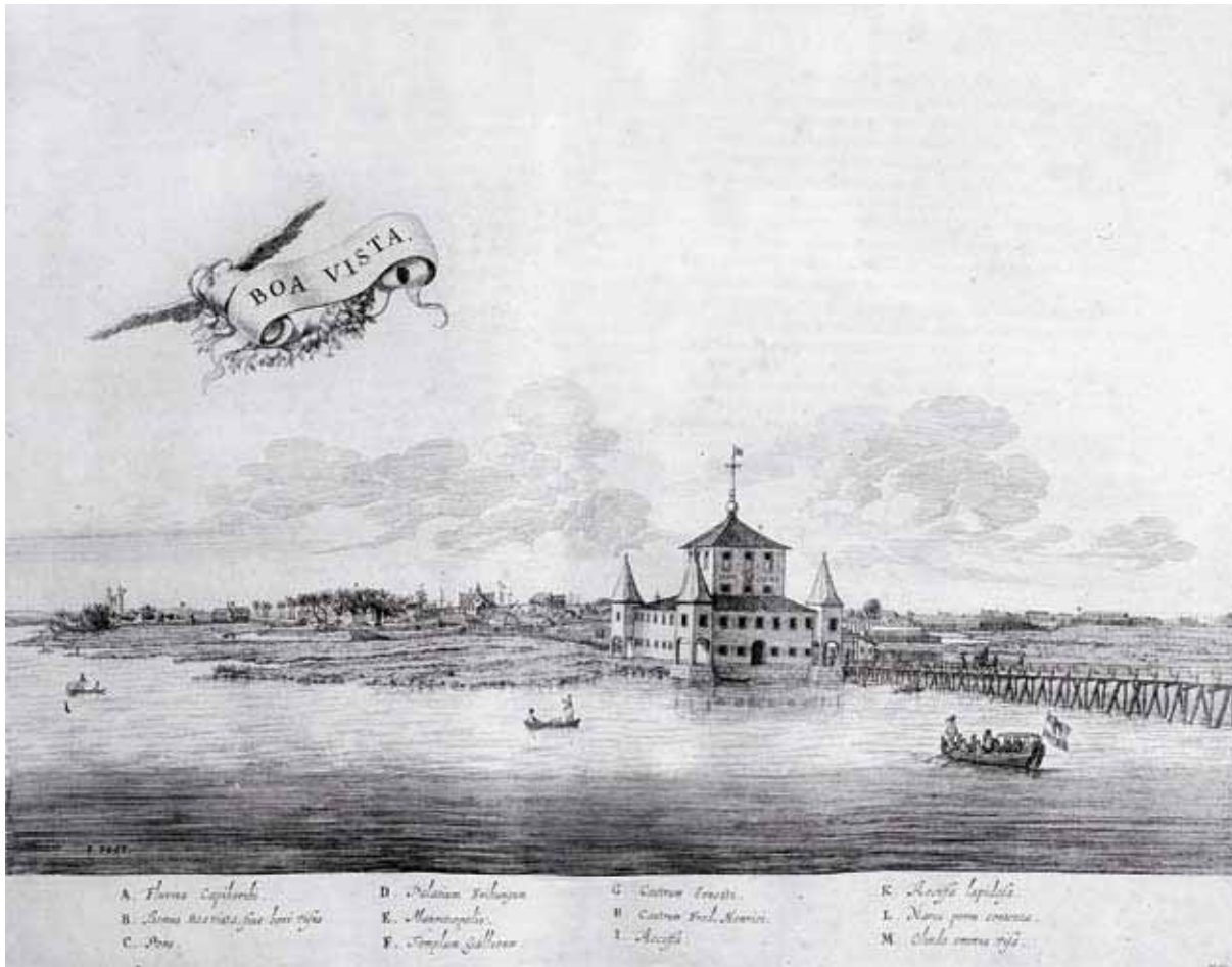
Palácio Boa Vista | 1645 gravura em metal.

O palácio Boa Vista, imensa fortificação na baía da Cidade Maurícia, arquitetada para modo de proteger a região recém firmada por Nassau. Consta-se que o holandês havia construído, de acordo com sua vontade e constate fiscalização, um outro monumento num sitio não muito distante dali. Cansado dos negócios públicos, ele ocupava suas horas vagas para momentos de descanso. Usada como residência secundária, pois o governante não podia se ausentar por muito tempo de sua gerência, e vale aqui lembrar que apesar de criar uma estrutura política com os moradores, aparentemente sólida, a passividade de ataque por conta da Coroa Portuguesa era totalmente aparente. Por isso, não a toa era sua localização,