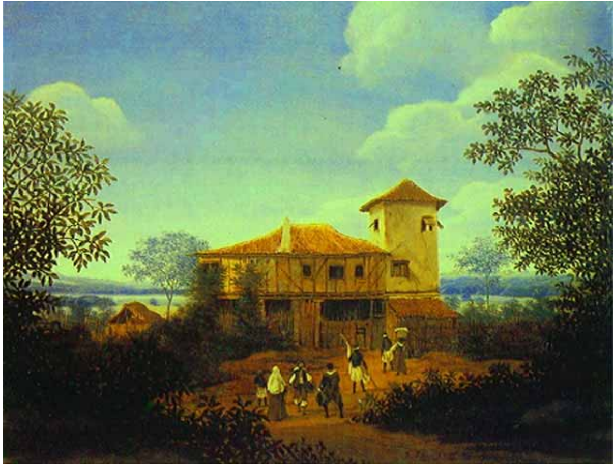
Figura 2: Casa de fazenda por Franz Post.

brasileira, salienta-se nessa imagem quando percebemos que mesmo utilizando-se da indumentária européia os indígenas usam cestos de cipós produzidos por eles próprios ou por seus pares.