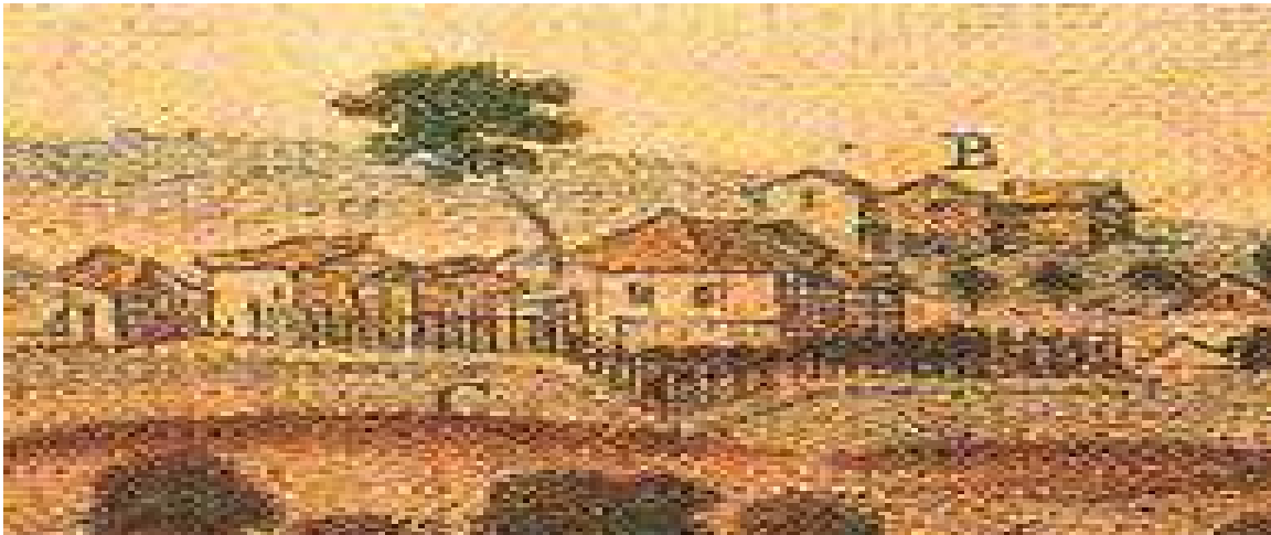
Figura 12. Detalhe da vista Sirinhaém, aparência semelhante entre as edificações.