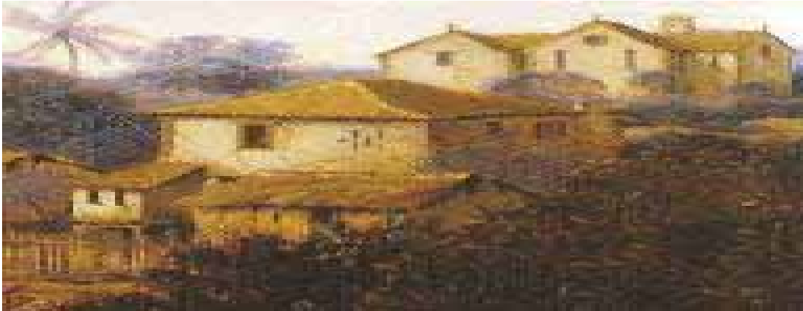
Figura 11. Detalhe da figura 26. possível casa do governador em primeiro plano e, acima, o convento franciscano.