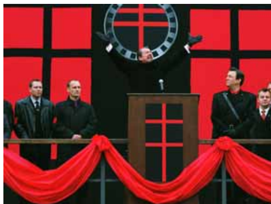
Adam Sutler discursando e membros ligados ao seu partido durante as eleições Interferência do Estado na Mídia

Em V de Vingança , nas primeiras cenas, vemos a forte influência do governo na mídia, que é controlada por ele. Depois da destruição do Bailey (símbolo da Justiça) por V, Adam Sutler ordena ao Sr. Dascomb – que faz parte do órgão de censura, o “olho” e responsável pela programação do canal BTN, que transmite os programas definidos pelo chanceler – a divulgar outra versão para a explosão que destruiu o edifício e assim esconder o que realmente ocorreu. Enquanto a notícia criada é divulgada, ao ser indagado se esta seria ou não convincente, Dascomb explica que a produção comandada por ele era responsável por divulgar as notícias e não criá-las, e que esta era a tarefa do governo – deixando visível a interferência do mesmo no que era ou não transmitido à população.