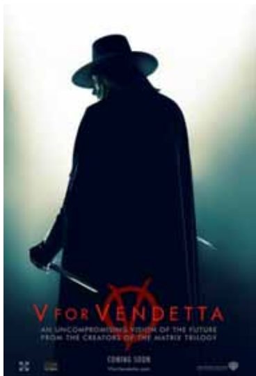
Cartaz de divulgação do filme V for Vendetta (2002)

Já o filme V de Vingança , lançado em 2006 pelo diretor James McTeigue, apesar de baseado na Graphic Novel trata-se de uma readaptação de um primeiro roteiro escrito pelos irmãos Wachowski, muito mais denso e longo do que o produzido na película, que tentava se manter o mais próximo possível à história original, se constituindo como base para o roteiro final.