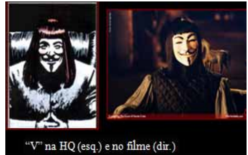
“V” na HQ (esq.) e no filme (dir.)

Adam Sutler (Adam Suzam na HQ): Conservador, religioso e extremamente autoritário, governa a Inglaterra, exercendo o cargo de Alto-Chanceler, sob um governo fascista.