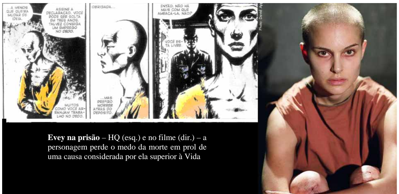
Evey na prisão – HQ (esq.) e no filme (dir.) – a personagem perde o medo da morte em prol de uma causa considerada por ela superior à Vida

Em nossa análise, Evey, assim como V passa a defender um ideal acima da Vida, que é deixada para um nível secundário o que como vimos trata-se de uma postura comum aos terroristas: os valores simbólicos prevaescem sobre qualquer outro valor.