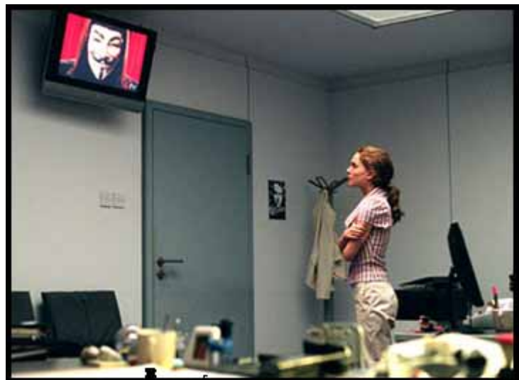
Evey assiste o discurso de V pela televisão – Difusão das idéias de V pela mídia.

neles em meio primeiro plano e rapidamente para o plano subjetivo inclinado para o canto da tela – o que faz com que a televisão também fique inclinada mantendo-a sempre presente e estabelecendo uma conexão direta entre V e os telespectadores – retorna para o meio primeiro plano e alterna novamente para V também em meio primeiro plano. Ao mencionar sobre a importância do diálogo, a câmera se mantém nos personagens principais (Gombrich, Evey, Sr. Finch) com o