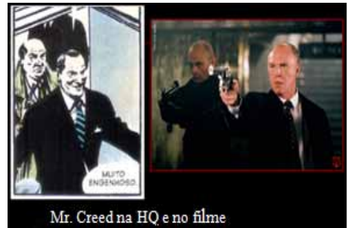
Mr. Creed na HQ e no filme

No caso da História em Quadrinhos em que há a presença de um maior número de personagens do que na versão cinematográfica (que se restringe aos mais importantes) esta abordagem psicológica dos personagens