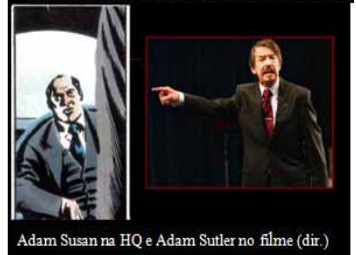
Adam Susan na HQ e Adam Sutler no filme (dir.)