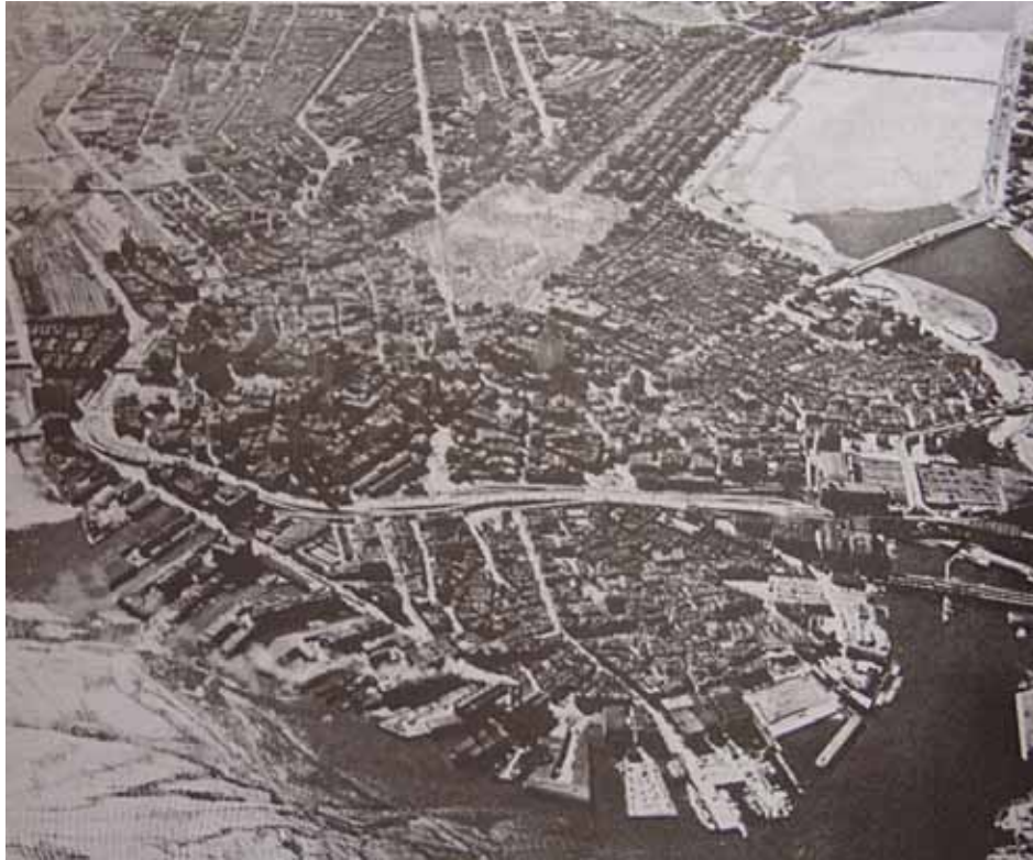
Península de Boston vista do norte – extraída do livro A Imagem da Cidade (1997).

A partir dessas transformações, foi possível definir direções e sentidos. Houve, ainda, a criação de imagens hierárquicas, que são constituídas por elementos adotados como referenciais. Pode-se, pois, dizer que determinada instituição fica ao lado da praça principal da cidade, localizada a oeste.