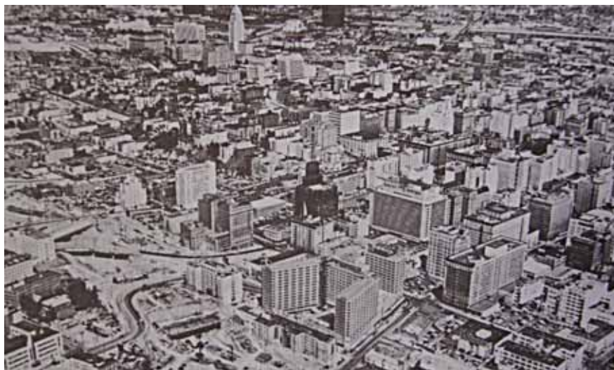
Los Angeles vista do oeste – extraída do livro A Imagem da Cidade (1997).